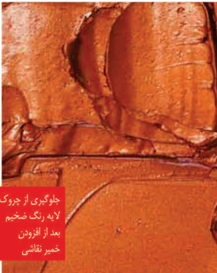
جلوگیری از چروک لایه رنگ ضخیم بعد از افزودن خمیر نقاشی

(Alla prima): تکنیک رنگ گذاری مستقیم و یکباره در نقاشی (بدون زیر رنگ).