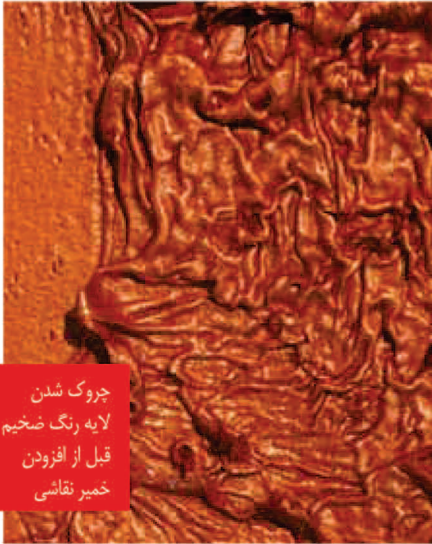
چروک شدن لایه رنگ ضخیم قبل از افزودن خمیر نقاشی

اگر در لایه ای، به مقدار زیادی رنگ استفاده شود، ممکن است در طی فرآیند خشک شدن چروک اتفاقی بیفتد. چروک لایه رنگ تا حدودی به رنگدانه آن بستگی دارد. رنگ های Cobalt blue, Burnt umber, Madder و Metallic و رنگهای صدفی همگی مثال هایی از رنگهای چروک شونده هستند.